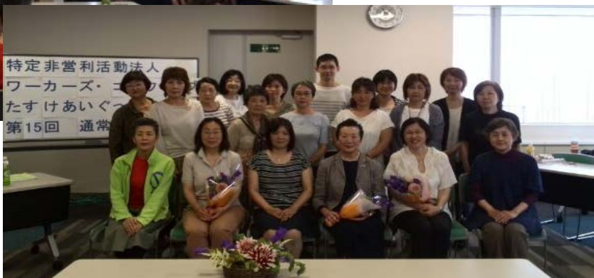
総会出席者で撮影