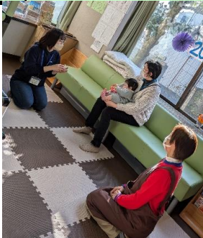
保育士さんとお話し