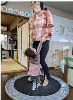
キッズタイム身体を動かそう!