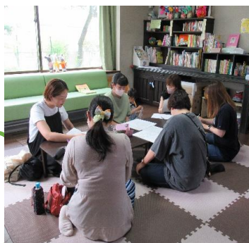
幼稚園ママに 聞いてみよう