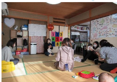
保育士さんのお話し(睡眠)