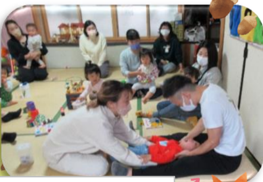
歯医者さんのお話

妊娠中、初めてご利用の方本人に限り、 利用料1回分無料。 切り取らず、このままお持ちください。